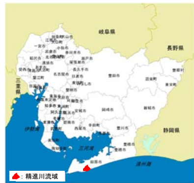
「この地図は、国土地理院の数値地図25000（地図画像）を使用したものである。」 (参考図) 精進川水系図