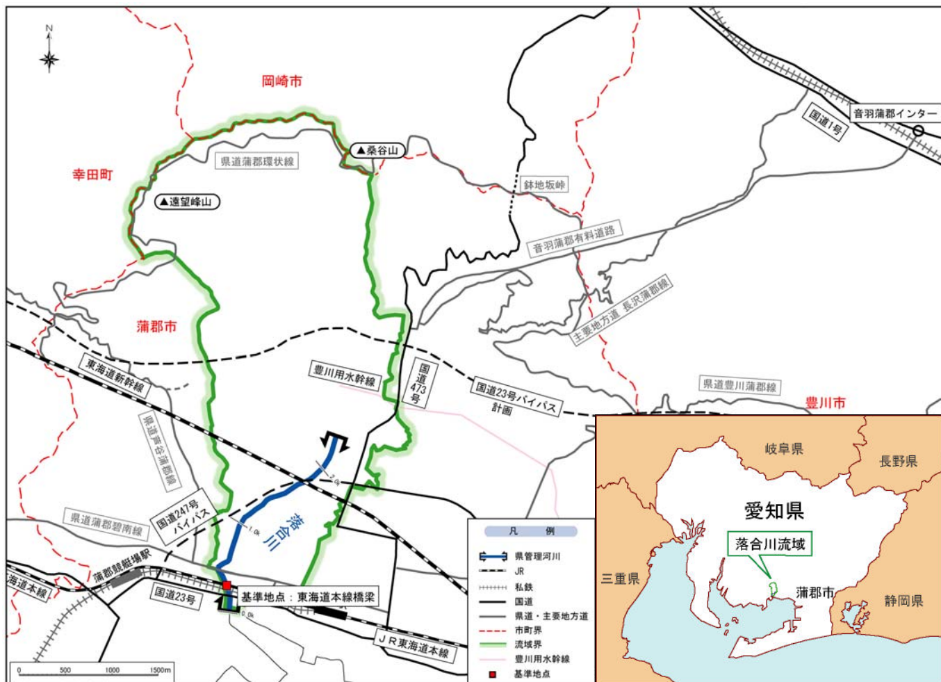
(参考図) 落合川水系図