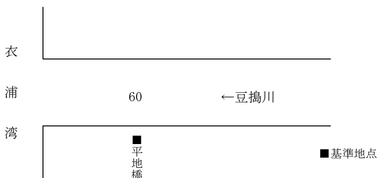
計画高水流量配分図（単位：m 3 /s）

豆搦川水系における計画高水流量は、基準地点の平地橋において 60m 3 /s とする。